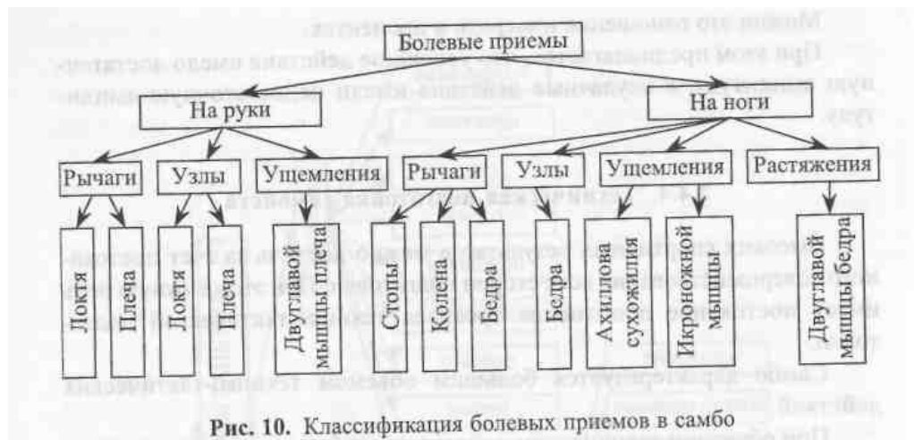
Рис. 10. Классификация болевых приемов в самбо